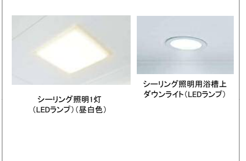
シーリング照明1灯(LEDランプ)(昼白色)