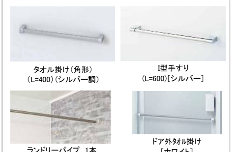
タオル掛け(角形)(L=400)(シルバー調)