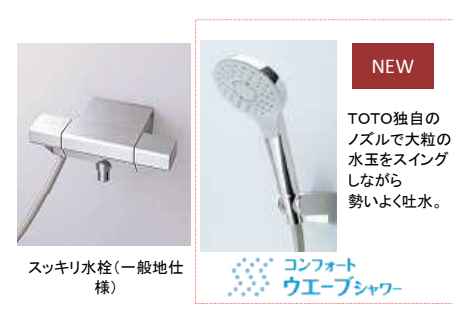
スッキリ水栓(一般地仕様)