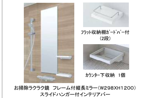
お掃除ラクラク鏡 フレーム付縦長ミラー(W298XH1200) スライドハンガー付インテリアバー