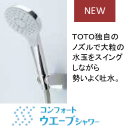
NEW TOTO独自のノズルで大粒の水玉をスイングしながら勢よく吐水。コンフォートウエアシャワー